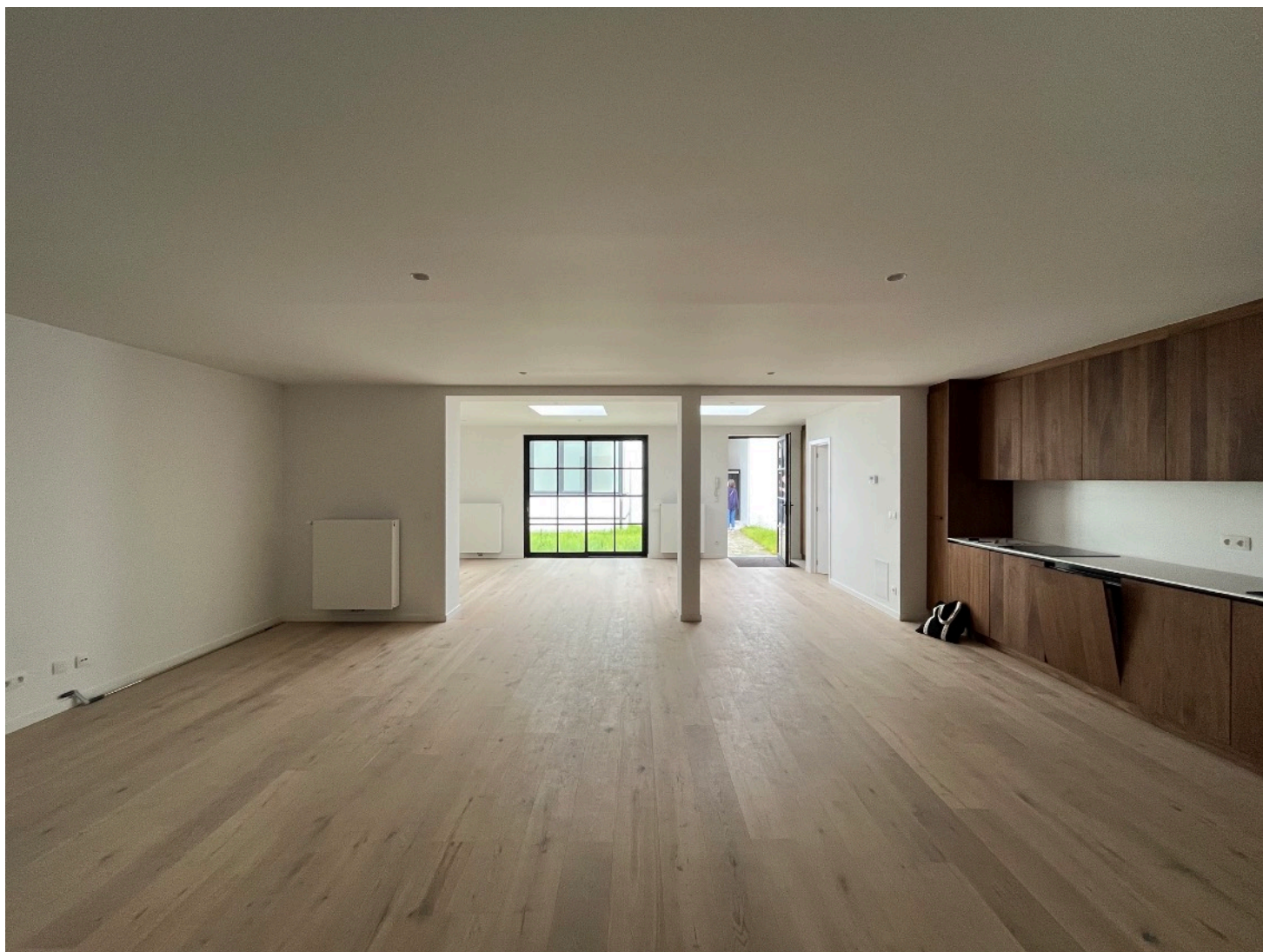
Vue intérieure : cuisine / séjour