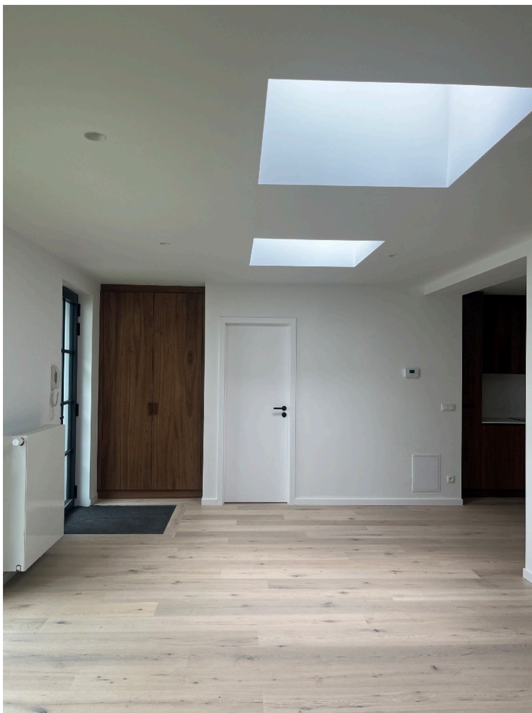
Vue intérieure : entrée / séjour