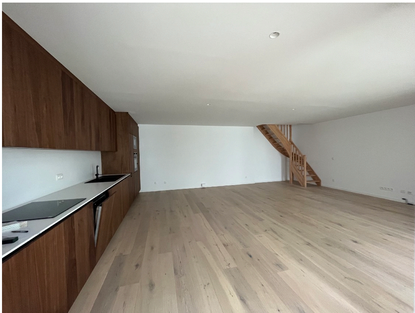
Vue intérieure : cuisine / séjour