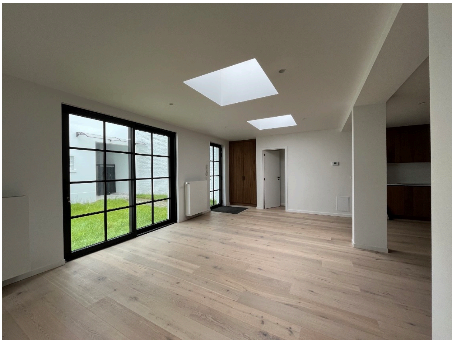
Vue intérieure : séjour